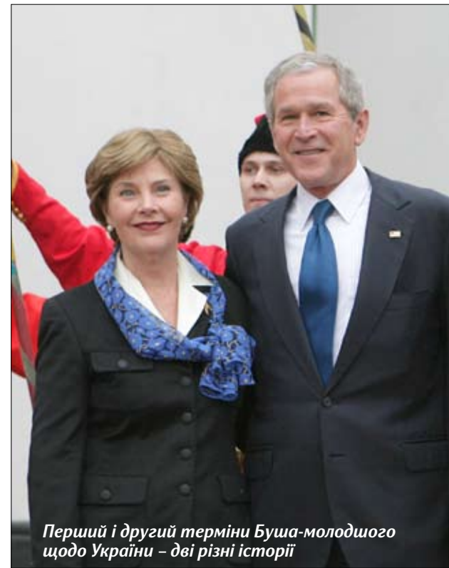
Перший і другий терміни Буша-молодшого щодо України – дві різні історії

Загалом, як і в цілому по Сполучених Штатах, Обаму підтримують, передусім, представники молодшого покоління й люди середнього віку. Ті, які асоціюють Республіканську партію США швидше з невдалим, на їхній погляд, восьмирічним правлінням Джорджа Буша-молодшого, ніж з агресивною риторикою Рейгана щодо Радянського Союзу чи заявами Ейзенхауера про