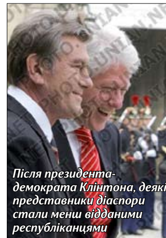
Після президента-демократа Клінтона, деякі представники діаспори стали менш відданими республіканцями

Тим не менше, сумно констатує Пизюр, «як у п'ятдесятих роках батьки голосували за Ейзенхауера, так їхні діти й до сьогодні продовжують голосувати за республіканців». «Чесно кажучи, виглядає дуже прикро й незрозуміло те, як багато розумних, освічених українських американців продовжують підтримувати політику Джорджа Буша, відмовляючись визнати шкоду, яку він завдав Америці», – щиро дивується представник нового покоління української діаспори в США, документаліст з