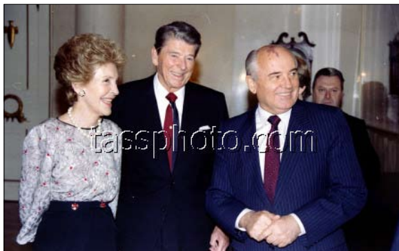
Рейгану американські українці завдячують тим, що «розвалив» Радянський Союз