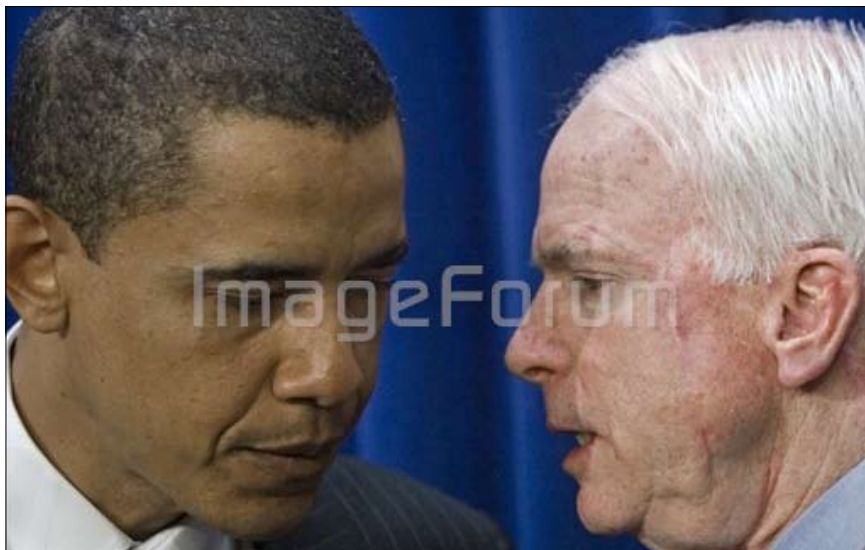
І Обама, і МакКейн, схоже, враховують український фактор