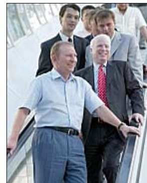
МакКейн добре знається на Україні з часів Кучми

нешодавно створеної в США групи «Українці за Обаму», говорить натомість про існування двох паралельних підходів: мовляв, одні представники діаспори орієнтуються на того кандидата, який може бути кращим для України, а інші на того, який, на їхній погляд, буде кращим для Сполучених Штатів.