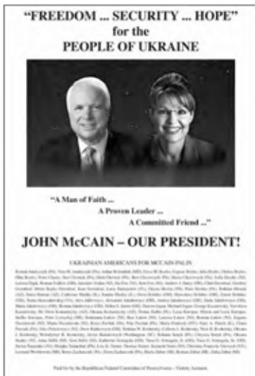
Такі рекламні проспекти напередодні з'явилися в діаспорній пресі