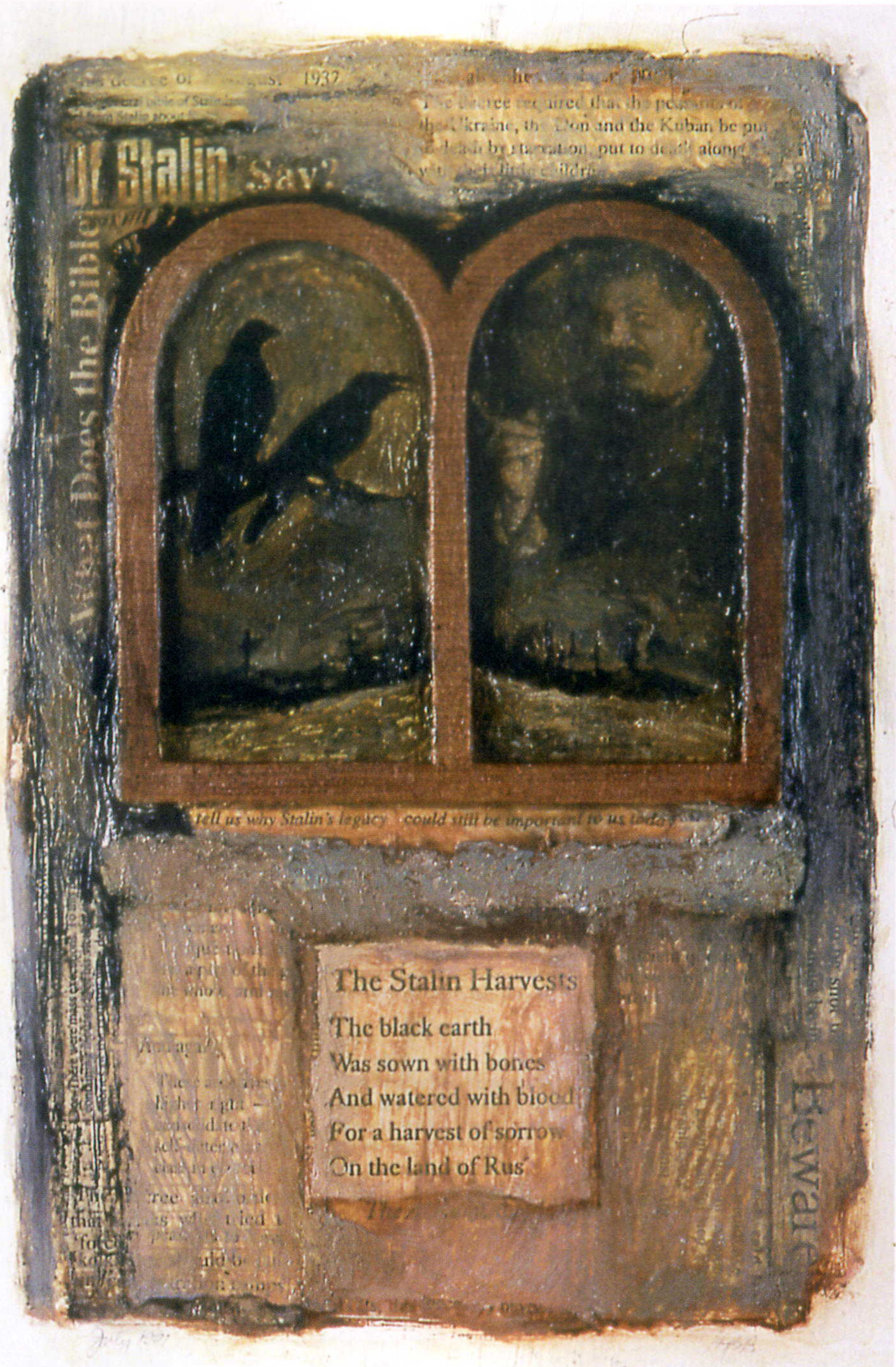
Укази геспота. Из серії "Фрагменти". Папір, олія, колаж. 1991. 30x23.